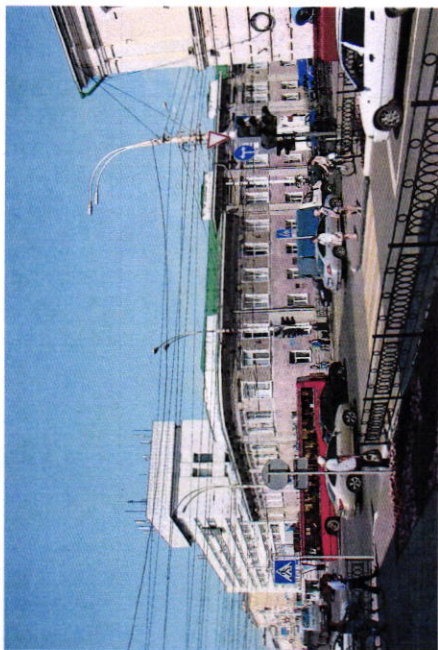
Вид со стороны севера на ул. Интернациональной